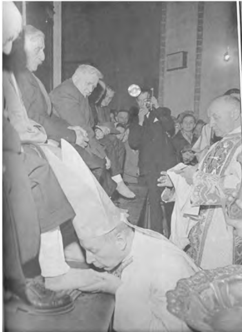
Obrzęd obmycia nóg

Na spotkaniu z ks. Prymasem stała się niemal cała wierna Częstochowa. Zadawano sobie pytanie, co powie i jakie będzie Jego przesłanie, a zarazem program działania na dalsze lata. „Otwórzcie drzwi dla miłości: do rozumu ludzkiego, aby poznać, że nawet prawdę zdobywa się w miłości. Otwórzcie drzwi dla miłości w woli człowieka, abyśmy zrozumieli, że dawać