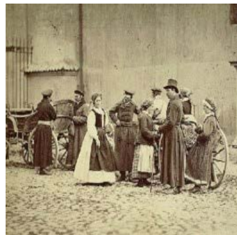
„Wieśniacy z Wilanowa w odświętnych strojach”

W tym czasie, kiedy Stanisław, z rąk księcia Kazimierza I otrzymuje Milanów, następuje potężny najazd zagonów litewskich na