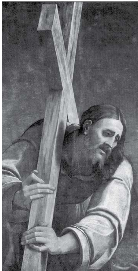
Chrystus dźwiga krzyż, Sebastiano Del Piombo, 1485–1547