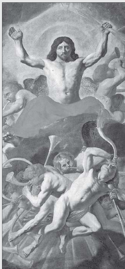
Sąd Ostateczny, Bernard van Orley, ok. 1542 r.