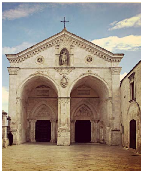
Sanktuarium św. Michała Archanioła w Monte Sant'Angelo

P. Módlmy się. Wszchemogący wieczny Boże, który świętego Michała Archanioła ustanowiłeś obrońcą Kościoła i zwierzchnikiem raju, udziel za jego wstawiennictwem Kościołowi pomyślności i pokoju, a nam łaski w tym życiu i chwały w wieczności. Przez Chrystusa Pana naszego. Amen.